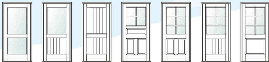
VU-1 VU-2 VU-3 VU-4 VU-5 VU-6 VU-7

Valik populaarsematest mudelitest, mida Viking Window pakub: