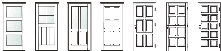
VU-8 VU-9 VU-10 VU-11 VU-12 VU-13 VU-14