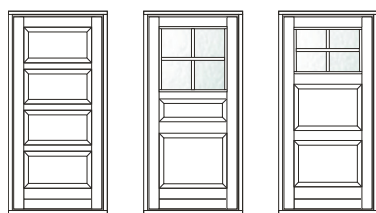
VU-15 VU-16 VU-18